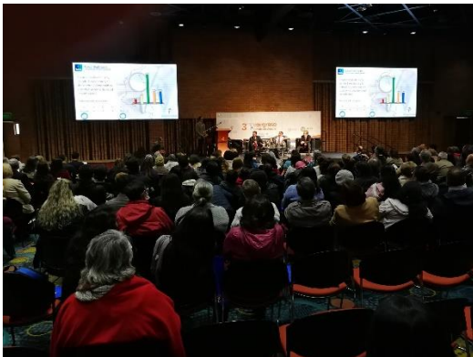
Primer panel Desafíos sistema de salud