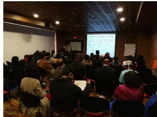
Nuevos tratamientos para MM