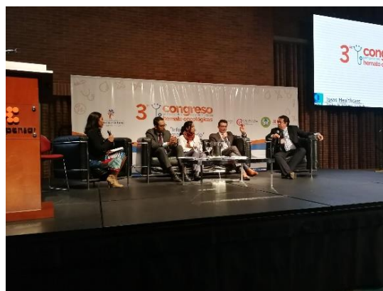
Panel 2 Acceso a terapias innovadoras