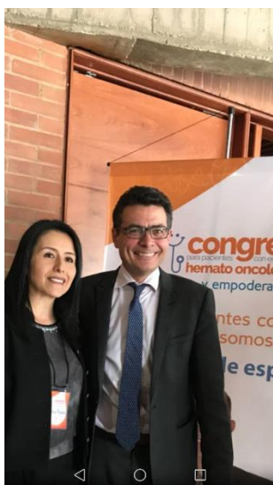
Ministro de salud y Presidenta Funcolombiana