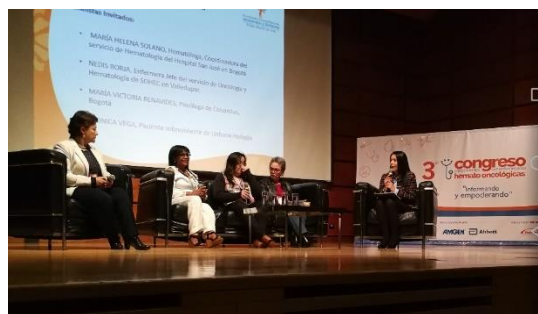
Panel 3. Tengo Cáncer, ¿qué debo hacer?