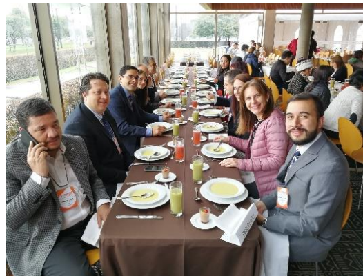
Almuerzo para médicos e invitados especiales