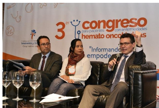
Panel 3 Acceso a terapias innovadoras

Muchas gracias por su decidido apoyo para hacer realidad este evento de actualización dirigido a pacientes y cuidadores.