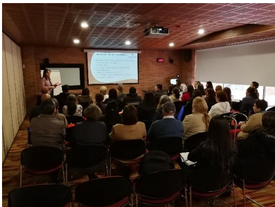
Tratamientos para LMC-LLC